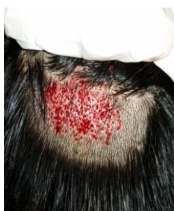
Lors du prélèvement